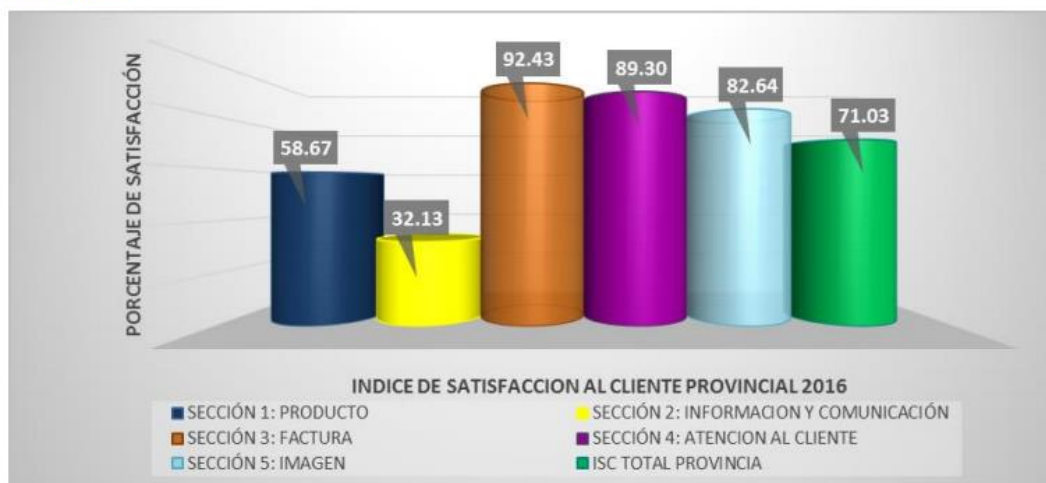
Fig 2. Indicadores de satisfacción al cliente (ISC).